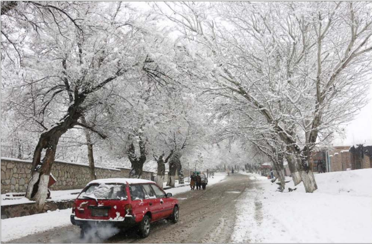
काबुल के पगमान इलाके में बर्फबारी का एक दृश्य।

नगोमा। नगोमा जिले के रुकुम्बरी सेक्टर में मुगसेरा नदी में एक नाव डूबने ने सोलह लोगों की मौत हो गई है। बचाव दल के एक अधिकारी ने रिविवा को यह जानकारी दी। स्थानीय अधिकारियों के अनुसार यह दुर्घटना शुक्रवार शाम रवामगाना जिले में मुगसेरा नदी पर हुई।