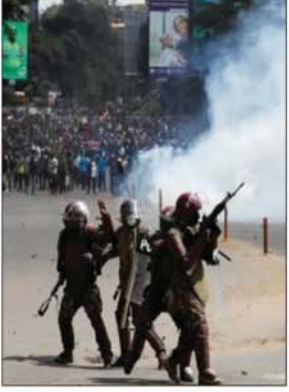
केन्या में क्यों बिगड़े हालात