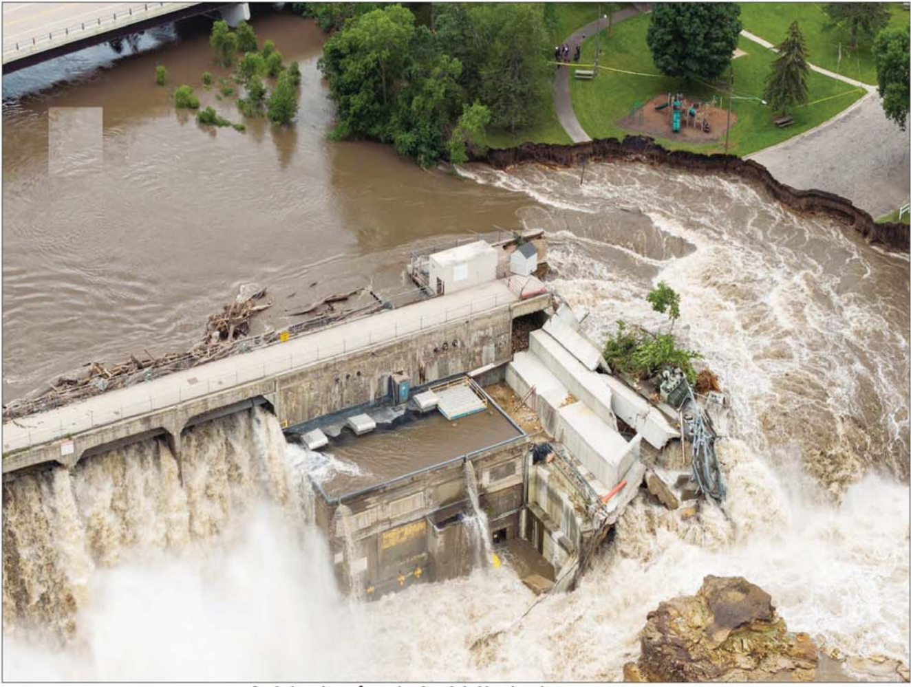
मिनीसोटा में आई बाढ़ के बीच ही रेपीडेम डेम में जमा हुआ कचरा।