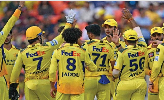
गेंदों पर 21 रन बनाकर नाबाद रहे।

उर्विल पटेल ने 19 गेंदों पर 37 रन बनाकर अपनी लय जारी रखी। वह रविश्रीनिवासन साई किशोर की गेंद पर शुभमन गिल के हाथों कैच आउट हुए। शिवम दुबे एक रन बनाकर शाहरुख खान के हाथों आउट हो गए, लेकिन डेवाल्ड ब्रेविस ने 23 गेंदों पर चार चौकों और पांच छकों की मदद से 57 रन बनाकर चेन्नई सुपर किंग्स को 200 रन के पार पहुंचाया। रवींद्र जडेजा 18