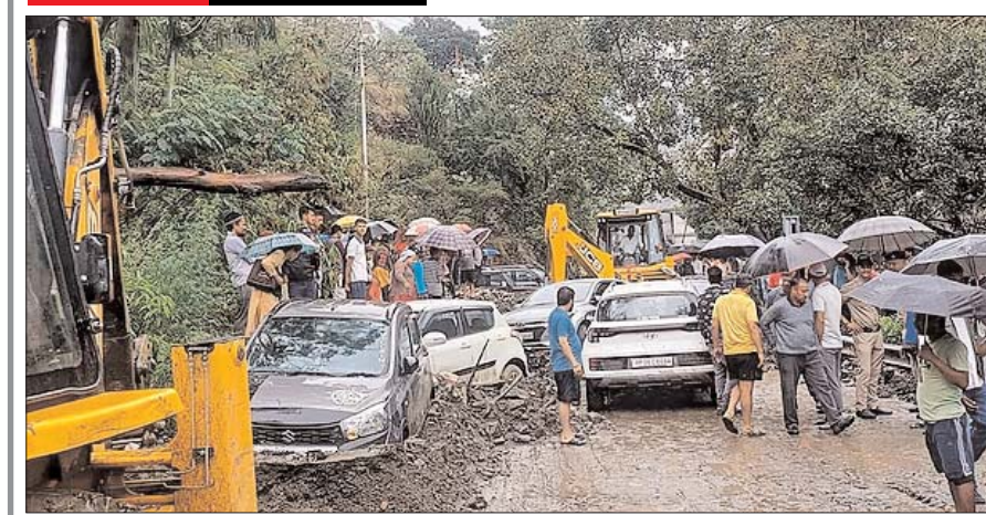
हिमाचल प्रदेश के कुल्लू जिले के जगतखाना में भारी बारिश के कारण अचानक आई बाढ़ के बाद मलबे में फसे वाहन।