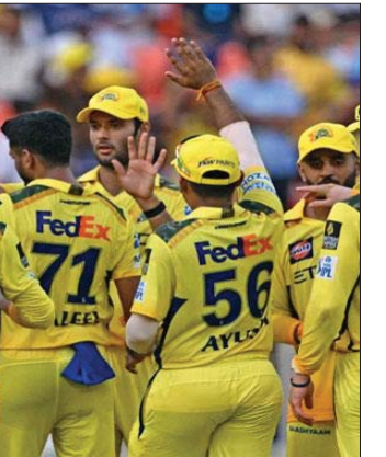
लेकिन सीएसके के बल्लेबाजों को रोकने में सफल रहे।

गुजरात के गेंदाबाजों में प्रसिद्ध कृष्णा ने चार ओवर में 22 रन देकर 2 विकेट चटकए। राशिद खान (4-0-42-1), साई किशोर (2-0-23-1), और शाहरुख खान (1-0-13-1) ने भी विकेट चटकए।