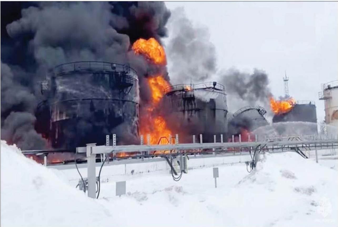
रूस में यूक्रेनी ड्रेन हमले के बाद एक तेल टैंकर में लगी आग बुझाते हुए दमकलकर्मी।

कथित तौर पर नासा ने अपने मंगल हेलीकॉप्टर इनजेनिटी से संपर्क खो दिया है। संभावित झटका तब आया जब इनजेनिटी लाल ग्रह पर अपने तीन साल के निशान के करीब थी, जिसने अपने विस्तारित मिशन के दौरान 71 उड़ान सफलतापूर्वक पूरी की। नासा के अधिकारियों के अपडेट के अनुसार, इनजेनिटी ने 18 जनवरी को लाल ग्रह पर अपनी 72वीं उड़ान भरी। पिछली उड़ान के दौरान एक अनियोजित प्रारंभिक लैंडिंग के बाद, हेलीकॉप्टर के सिस्टम की जांच करने के लिए उड़ान को एक त्वरित पीप-अप ऊर्ध्वाधर उड़ान के रूप में डिजाइन किया गया था। उड़ान के दौरान द्रुतता रोवर (जो हेलीकॉप्टर और पृथ्वी के बीच एक रिले के रूप में कार्य करता है), की भेजा गया डेटा इनजेनिटी डीगिट करता है कि यह 40 फीट ( 12 मीटर) की निर्धारित अधिकतम ऊंचाई पर सफलतापूर्वक चढ़ गया। अपने नियोजित अवतरण के दौरान, लैंडिंग से पहले, हेलीकॉप्टर और रोवर के बीच संचार जल्दी समाप्त हो गया,। अंतरिक्ष एजेंसी ने कहा कि इनजेनिटी टीम उपलब्ध डेटा का विश्लेषण कर रही है और हेलीकॉप्टर के साथ संचार को फिर से स्थापित करने के लिए अगले कदमों पर विचार कर रही है।