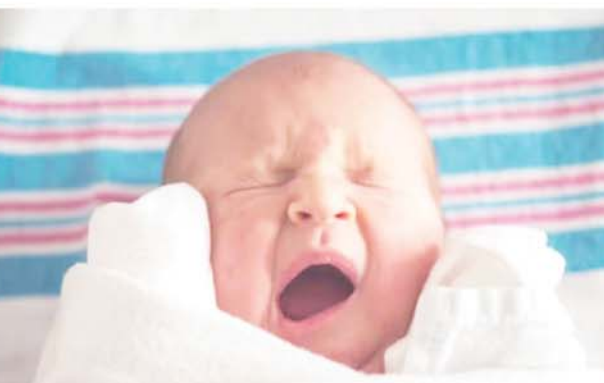
चार प्रतिशत से कम रह सकती है। 1960 के दशक से विश्व जनसंख्या वृद्धि धीमी हो रही है। वैश्विक जनसंख्या को सात अरब से आठ अरब होने में साढ़े 12 साल लग गए। लेकिन जनगणना ब्यूरो का कहना है कि आठ अरब से नौ अरब होने में 14.1 साल लगे और नौ अरब से 10 अरब होने में 16.4 साल लगे, जो 2055 के आसपास हो सकता है।

वाशिंगटन, एजेंसी। आने वाले नए साल में दुनिया की आबादी भी एक नया रिकॉर्ड बनाने वाली है। इस साल विश्व की जनसंख्या में लगभग साल 7.5 करोड़ का इजाफा हुआ। नए साल के दिन कुल वैश्विक आबादी के आठ अरब से अधिक हो जाने का अनुमान है। अमेरिकी जनगणना ब्यूरो द्वारा जारी आंकड़ों में यह जानकारी दी गई है। जनगणना ब्यूरो के आंकड़ों के अनुसार, पिछले साल दुनिया भर में जनसंख्या की वृद्धि दर एक प्रतिशत से कम रही। वर्ष 2024 की शुरुआत में दुनिया भर में हर सेकंड में 4.3 लोगों का जन्म और दो लोगों की मौत होने का अनुमान है।