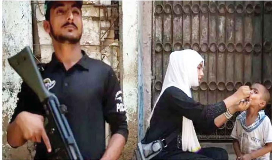
बच्चों को पोलियो ड्रॉप पिलानी चाहिए। विश्व स्वास्थ्य संगठन के अनुसार, पाकिस्तान अपने पड़ोसी अफगानिस्तान के साथ-साथ दुनिया के दो पोलियो से पीड़ित देशों में से एक है। स्वास्थ्य मंत्रालय ने कहा कि पाकिस्तान में इस साल अब तक पोलियो के छह मामले सामने आए हैं।

स्वास्थ्य मंत्रालय ने की परिवारों से अपील: स्वास्थ्य मंत्रालय ने कहा कि माता-पिता को प्रत्येक पोलियो अभियान के दौरान पांच साल से कम उम्र के