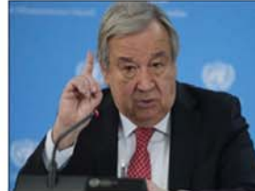
गुटेरेस युद्ध संघर्ष फैलने के बारे में चिंतित हैं और संकट के समाधान की बात कही है। उन्होंने बताया कि दवावस में विश्व आर्थिक मंच की बैठक में शामिल गुटेरेस ने इराक के पीएम मोहम्मद शिया अल-सुदानी और इराक के कुर्द क्षेत्र के अध्यक्ष नेचरवन बरजानी के साथ बैठकों में क्षेत्रीय स्थिति पर चर्चा की। अमली कार्रवाई के तौर पर पाकिस्तान और इराक ने ईरान से अपने राजदूतों को वापस बुला लिया और इस्लामाबाद ने तेहरान के दूत को देश लौटने से रोक दिया है। ईरान के रक्षा मंत्री मोहम्मद रजा अशियाथानी ने कहा कि जब कोई ईरान को धमकी देता तो हम प्रतिक्रिया देते और यह प्रतिक्रिया कठोर और निर्णायक होगी। उन्होंने चेतावनी दी, हम दुनिया में एक मिसाइल शक्ति हैं। वहीं पाकिस्तान के विदेश मंत्रालय ने हमले के गंभीर परिणामों की चेतावनी दी है। उन्होंने कहा कि इसकी जिम्मेदारी पूरी तरह से ईरान की होगी।

न्यूयॉर्क (एजेंसी)। संयुक्त राष्ट्र महासचिव एंटोनियो गुटेरेस ने पाकिस्तान के अंदर ईरानी हमले को लेकर चिंता जाहिर की है। उन्होंने कहा कि एक ओर जहां इजरायल-हमास संघर्ष से उत्पन्न संकट से देश बाहर नहीं निकले हैं वहीं अब यह हमला चिंता का विषय है। यह बात उनके प्रवक्ता स्टीफन दुजारिक ने कहा है। दुजारिक ने बुधवार को कहा कि वह पाकिस्तान में आतंकी ठिकानों पर ईरानी हमलों के बारे में बहुत ज्यादा चिंतित है, इसमें कथित तौर पर दो बच्चों की मौत हो गई और कई अन्य घायल हो गए। उन्होंने कहा कि वह संयम बरतने और आगे किसी भी तनाव से बचने की अपील करते हैं। गौरतलब है कि ईरान ने मंगलवार को पाकिस्तान में करीब 50 किलोमीटर अंदर बलूचिस्तान के कोह-ए-सज्ज में सुन्नी आतंकी समूह जैश अल-अदल के दो ठिकानों पर मिसाइलों और ड्रोन से हमला किया था। इसके पहले सोमवार को तेहरान ने इराक में कुर्द क्षेत्र की राजधानी इरबिल में एक इजरायली खुफिया केंद्र और उत्तरी सीरिया के इर्दलिन में सुन्नी इस्लामिक स्टेट आतंकवादी संगठन के अंडे पर हमला किया था।