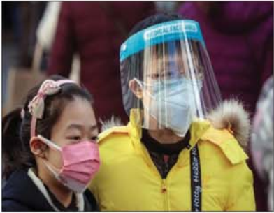
की मौत का कारण बनने वाले प्रकोप को किस हद तक नियंत्रित किया जा सकता था, इसके बारे में सवाल उठता है, अगर दुनिया को इसके बारे में सिर्फ पहुंच के स्तर और आने वाले महीनों में लाखों लोगों

बीजिंग (एजेंसी)। द वॉल स्ट्रीट जर्नल द्वारा एक्सेस किए गए अमेरिकी कांग्रेस की जांच से संबंधित दस्तावेजों से पता चला है कि चीनी शोधकर्ताओं ने दिसंबर 2019 में बीजिंग द्वारा इसे दुनिया के सामने प्रकट करने से कम से कम दो सप्ताह पहले कोविड -19 वायरस की मैपिंग की थी। दस्तावेजों में कहा गया है कि चीनी शोधकर्ताओं ने 28 दिसंबर, 2019 को अमेरिकी सरकार द्वारा संचालित डेटाबेस में SARS-CoV-2 वायरस का लगभग पूरा अनुक्रम अपलोड किया। हालांकि, चीनी अधिकारियों ने 11 जनवरी को ही विश्व स्वास्थ्य संगठन के साथ डेटा साझा किया।