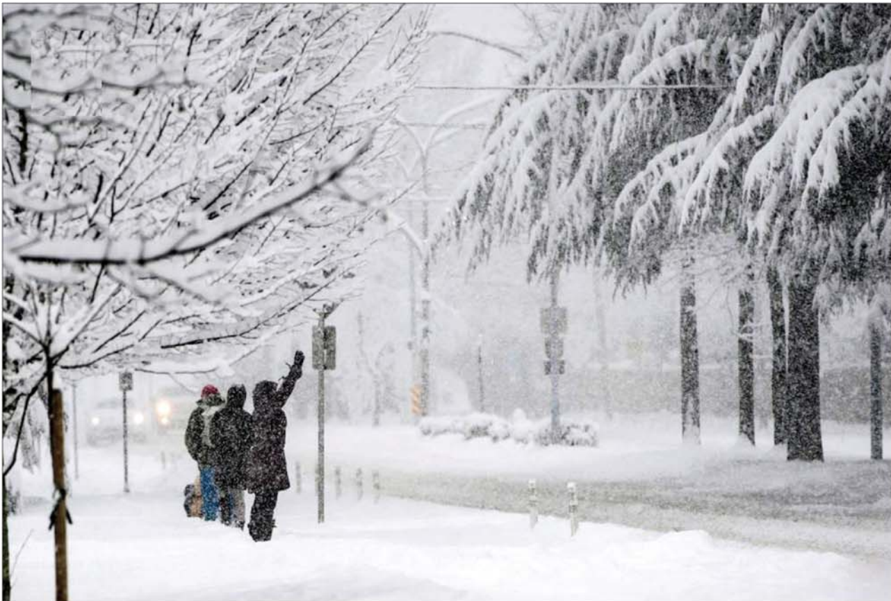
कनाडा में भारी बर्फबारी के बीच ही सड़क किनारे वाहनों का इंतजार करते हुए लोग।