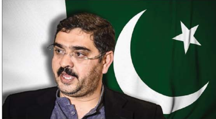
जटिल ऑपरेशन का सफल क्रियान्वयन पाकिस्तान सशस्त्र बलों की व्यावसायिकता का भी प्रमाण है। पाकिस्तान अपने लोगों की सुरक्षा

और संरक्षा को बनाए रखने के लिए सभी आवश्यक कदम उठाना जारी रखेगा जो पवित्र है, अनुकूलनीय और पवित्र है।