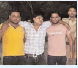
P- 3 नोएडा पुलिस ने बदमाश के पैर में मारी गोली