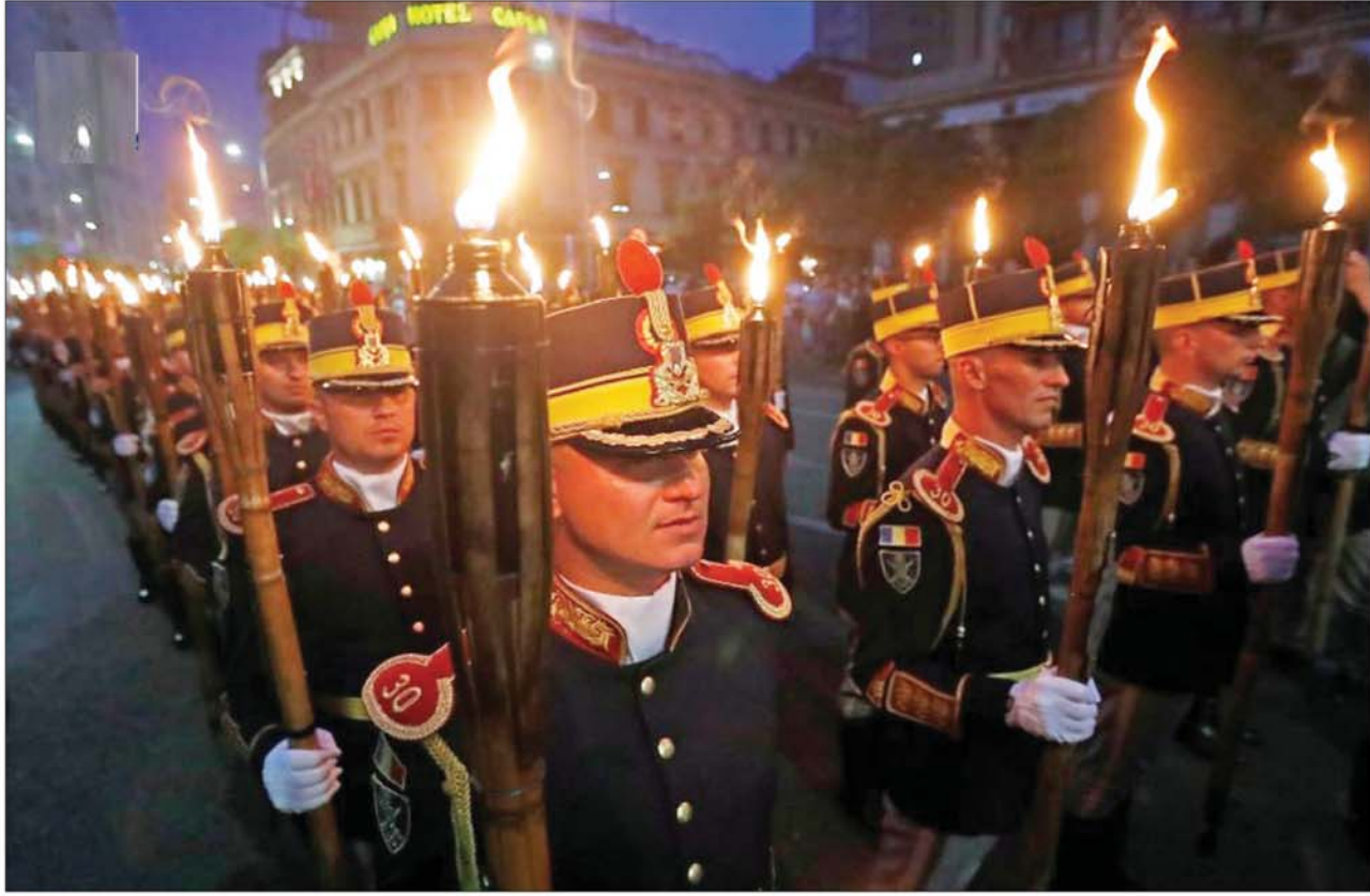
बुखारेस्ट में रोमानियाई सैनिक हीरोज डे को लेकर टार्च जलाकर खुशी व्यक्त करते हुए।