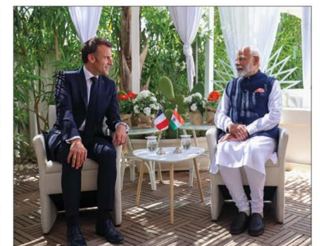
सोशल मीडिया पर जमकर वायरल हो रहा है। इस वक्त इटली में जी7 देशों के मेहमानों के साथ-साथ वहां तमाम देशों के मेहमान मौजूद हैं जिन्हें इटली ने जी7 शिखर सम्मेलन में हिस्सा लेने के लिए आमंत्रित किया है।

जी7 लोकतंत्र रूस की सैन्य कार्रवाइयों के चीन के कथित समर्थन पर साझा प्रतिक्रिया तलाश रहा है, जिसके बारे में अमेरिका का कहना है कि इससे यूक्रेन में युद्ध बिगड़ रहा है। वहीं जापानी सरकार के सूत्र ने बताया, जी7 देश इस बात पर सहमत हैं कि चीन से कैसे निपटा जाए। यह बैठक चीन और पश्चिम के बीच व्यापार संबंधों के