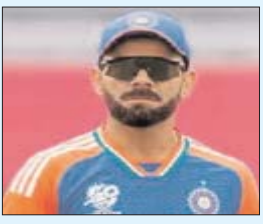
P- 6 कनाडा के खिलाफ मुकाबले में विराट पर रहेगी सभी की नजरें