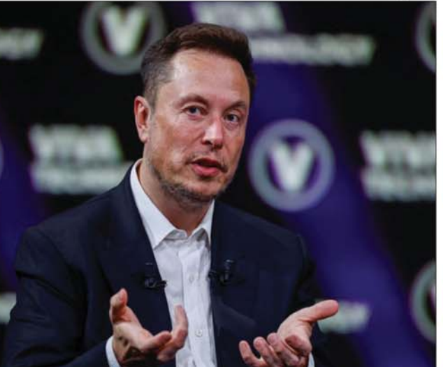
पैकेज को अपनी मंजूरी दी, कुछ शेयरहोल्डर्स जो इसके खिलाफ हैं, कोर्ट पहुंच गए। कोर्ट में फाइल केस में शेयरधारकों ने कहा है कि कंपनी के जिन निदेशकों ने मस्क के पक्ष में वोट किया है, वे उनके शेयरहोल्डर्स से अपनी मंजूरी दे दी है। तब लाए गए पैकेज की आज वैल्यू 56 अरब डॉलर है, क्योंकि 2018 में टेस्ला की मार्केट वैल्यू 59.1 अरब डॉलर थी, जो आज 570 अरब डॉलर हो गई है। मस्क के भारी-भरकम सैलरी पैकेज पर सिर्फ 73 फीसदी शेयरहोल्डर्स ने ही मंजूरी दी है, जबकि अमूमन कॉरपोरेट जगत में इस तरह के पैकेज को 95 फीसदी शेयरहोल्डर्स अपनी मंजूरी देते हैं। हालांकि, बहुमत से पैकेज को हरी झंडी मिल चुकी है। हेडक्वार्टर डेलवियर से टेक्सस शिफ्ट करने पर भी मुहर लगा दी है। साथ ही दो बोर्ड मेंबर को रि-इलेक्ट करने पर भी मंजूरी दे दी है। जैसे ही कंपनी के बोर्ड और शेयरहोल्डर्स ने

मस्क को साल 2018 में ही इस पैकेज को देने के लिए प्रस्ताव लाया गया था, लेकिन तब कंपनी के कुछ शेयरहोल्डर्स के विरोध के कारण कोर्ट ने इस पर रोक लगा दी थी। हालांकि, इस बार अधिक शेयरहोल्डर्स ने अपनी मंजूरी दे दी है। तब लाए गए पैकेज की आज वैल्यू 56 अरब डॉलर है, क्योंकि 2018 में टेस्ला की मार्केट वैल्यू 59.1 अरब डॉलर थी, जो आज 570 अरब डॉलर हो गई है। मस्क के भारी-भरकम सैलरी पैकेज पर सिर्फ 73 फीसदी शेयरहोल्डर्स ने ही मंजूरी दी है, जबकि अमूमन कॉरपोरेट जगत में इस तरह के पैकेज को 95 फीसदी शेयरहोल्डर्स अपनी मंजूरी देते हैं। हालांकि, बहुमत से पैकेज को हरी झंडी मिल चुकी है। हेडक्वार्टर डेलवियर से टेक्सस शिफ्ट करने पर भी मुहर लगा दी है। साथ ही दो बोर्ड मेंबर को रि-इलेक्ट करने पर भी मंजूरी दे दी है। जैसे ही कंपनी के बोर्ड और शेयरहोल्डर्स ने