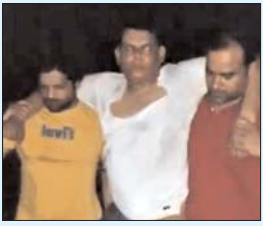
P- 4 रिटायर्ड दरोगा के सिपाही बेटे ने पुलिस पर की फायरिंग