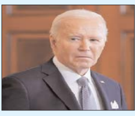
P- 5 इजरायल और हममास जंग के रुकने के अभी कोई असार नहीं : बाइडेन