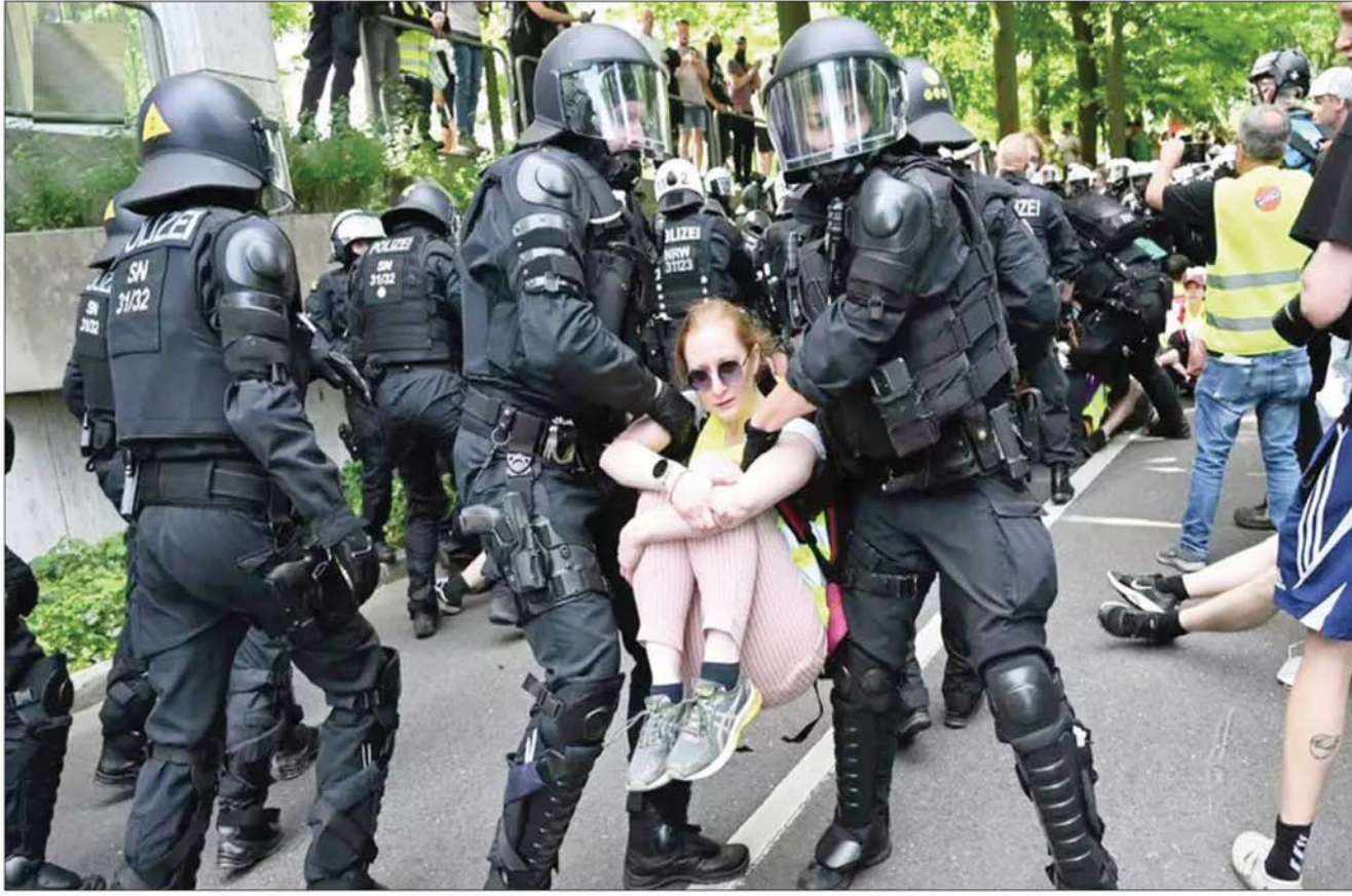
जर्मनी में एफडी पार्टी का विरोध कर रहे लोगों ने सड़क पर अवरोधक लगा दिये। जिन्हें पुलिस ने हटाया।